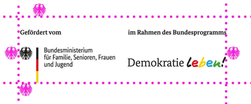
Illustration: Schutzraum um das Logo